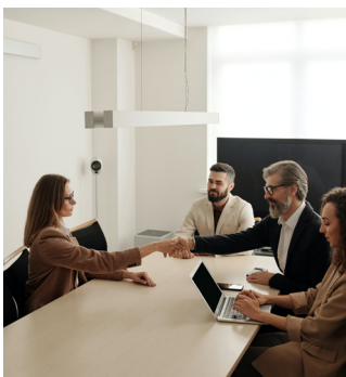
Área Comercial y Ventas: Vendedores.