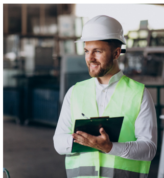
Producción y mantenimiento: Técnicos, operarios, supervisores e ingenieros.